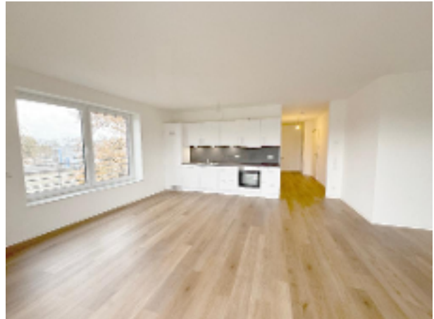
Wohnraum mit offener Küche