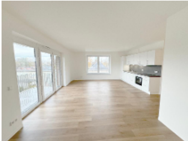
Wohnraum mit offener Küche