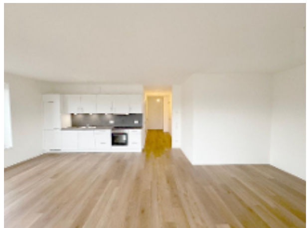
Wohnraum mit offener Küche