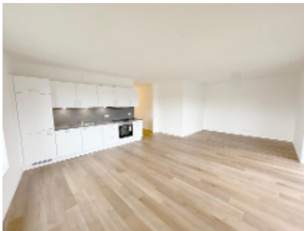
Wohnraum mit offener Küche