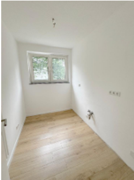
Küche ohne EBK