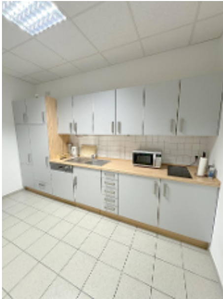
Gemeinschaftlich nutzbare Küche