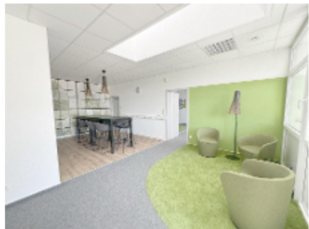
Lounge mit Essbereich