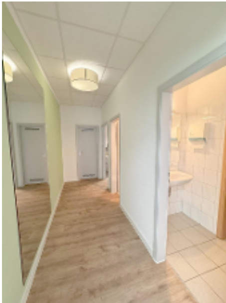
Flur zur Küche und Sanitärbereichen