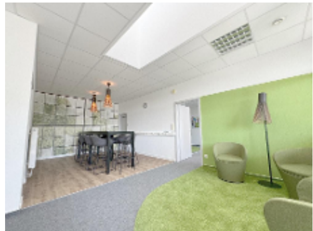
Lounge mit Essbereich