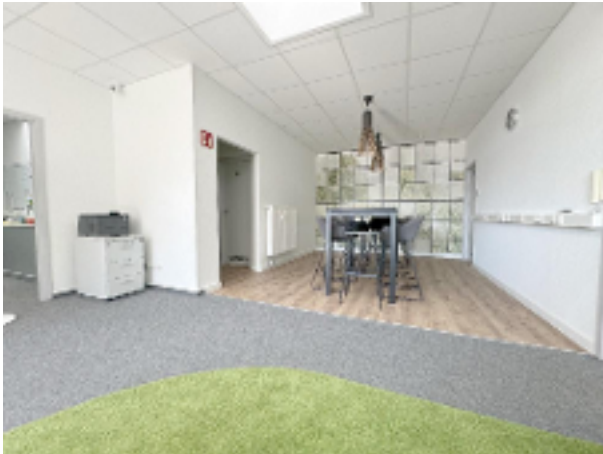
Lounge mit Essbereich